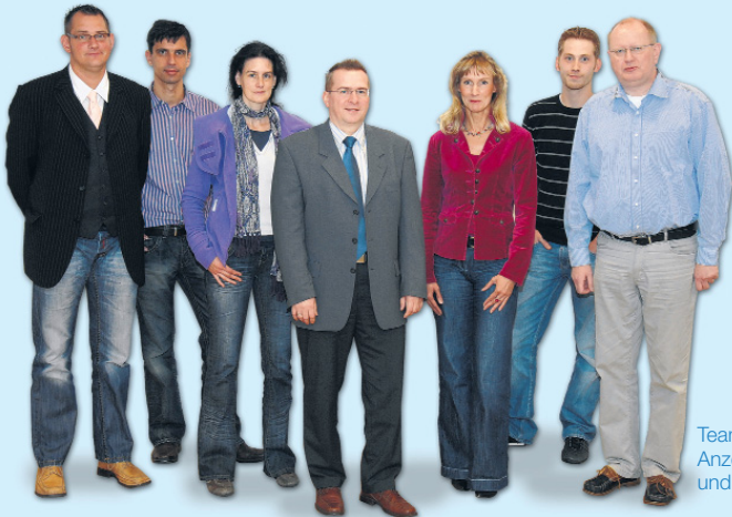
Team der Sonntagszeitung: Anzeigen, Redaktion, Technik und Vertrieb